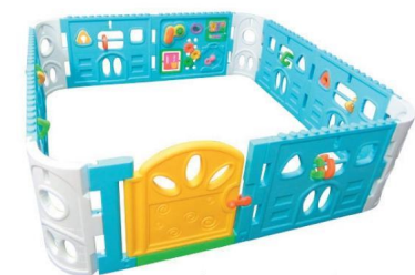
PARQUE MULTIACTIVIDADES GUARDERIAS